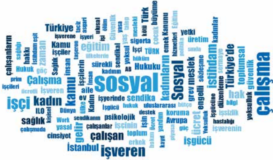
Grafik 5. Karatahta İş Yazıları Dergisi'nde Yer Alan 110 Makalede En Sık Kullanılan Kelimelerden Oluşan Kelime Bulutu

Dergide en sık tekrarlanan temel anahtar kelimelerin ortaya çıkarılabilmesi için MAXQDA Analytics Pro 2018 nitel analiz programından yararlanılmıştır. Kullanılan kelime sıklıklarına dayalı kelime bulutu Grafik 5'te verilmektedir.